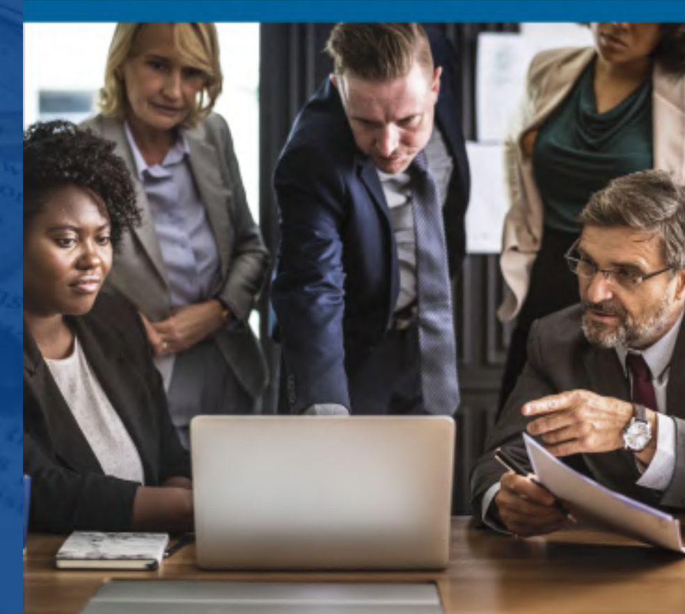
Profesionales dedicados al asesoramiento financiero y fiscal